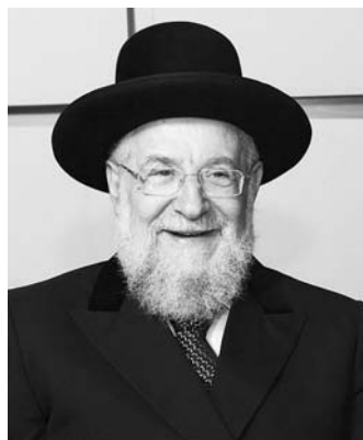
Раввин Исроэль-Меир Лау

бывает в Германии. Мне посчастливилось познакомиться с ним в Берлине на открытии Хабад-центра. Рав не испытывает абсолютно никакой ненависти к немецкому народу и очень объективно и непредвзято оценивает положение евреев в Германии.