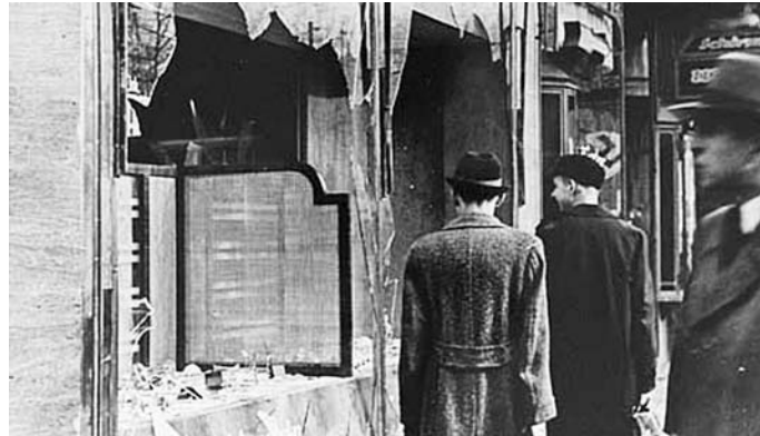
После погрома. Ноябрь 1938

Бранденбург, подчеркнул, что эти призывы местных политиков воспринимаются сегодня скорее как насмешка: ведь в земле Бранденбург невозможно сегодня снова поджечь синагоги, еврейские школы, детские