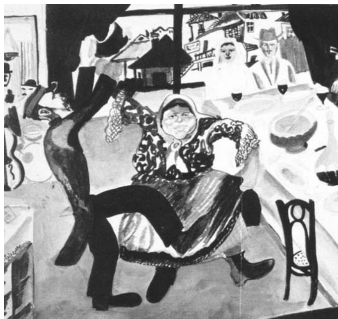
Марк Шагал „Еврейская свадьба„ (фрагмент)