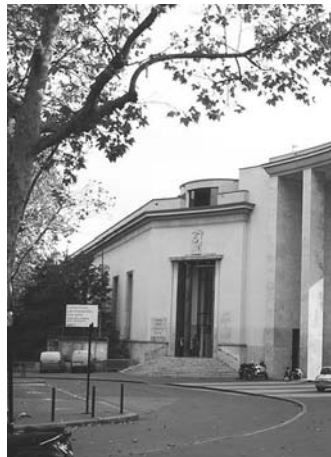
Парижский музей современного искусства

ставке, сделаны во время Израильской военной операции «Литой свинец». Виденхофлер находился в это время в Газе под покровительством бандитов ХАМАСа и фотографировал «мирных» жителей, пострадавших от военных действий. За свои работы